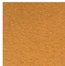
Orange Réf : 103-005