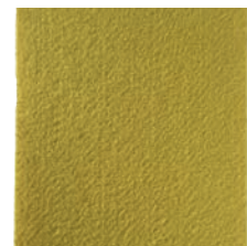
Jaune Réf : 103-002