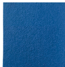
Bleu Foncé Réf : 103-007